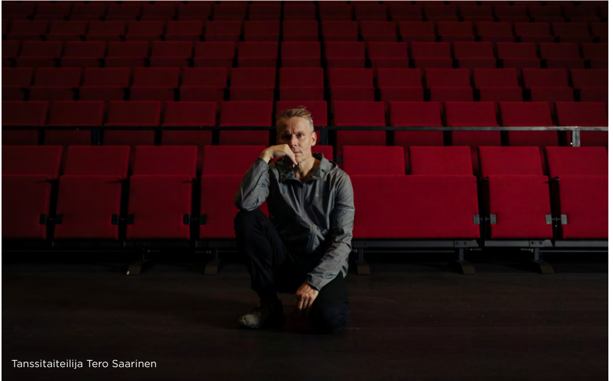
Tanssitaiteilija Tero Saarinen